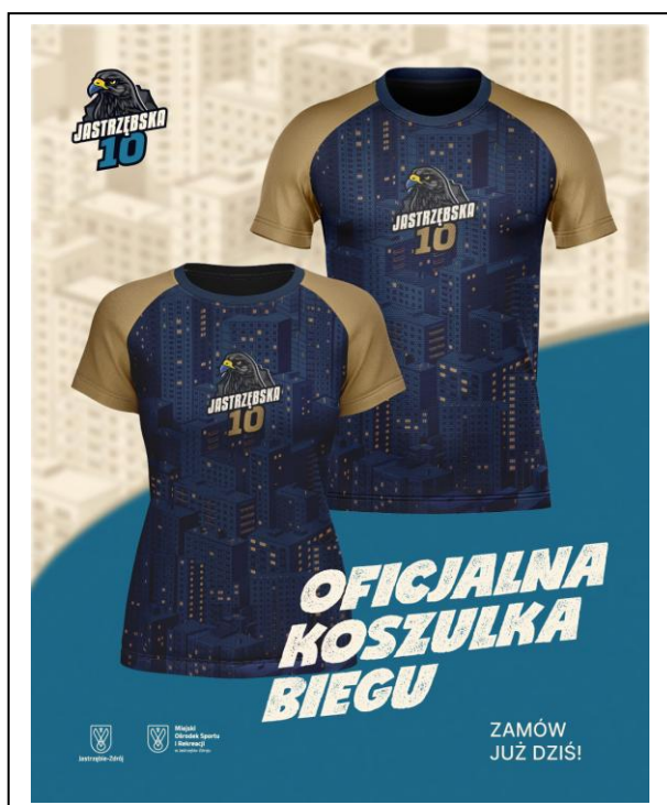
SPD 1106 - Koszulka męska z krótkim rękawem / Men's short sleeve shirt